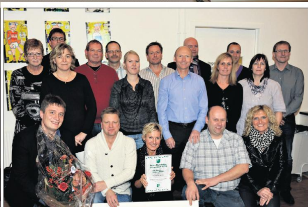
De glade medarbejdere ved Esbjerg Mejeri får ud over hæderens som årets rummelige virksomhed en check på 50.000 kr.