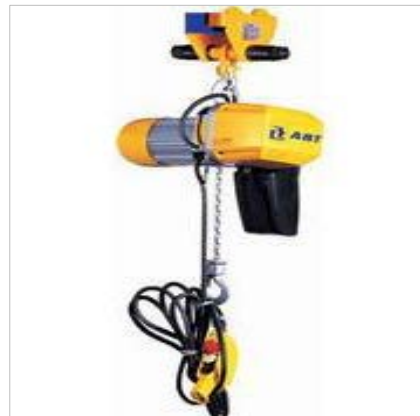
Hejse-, løfte- og transportredskaber er f.eks. kraner, taljer, spil, gaffeltruck, stabletruck, løftevogne, personløftere, transportører, rullebaner